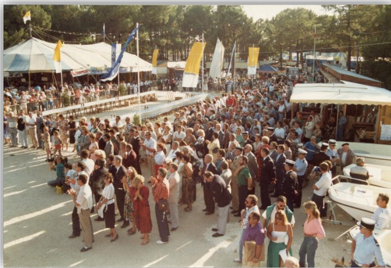
La foule pour l'ouverture des Gigas 1989

Les Archives municipales de Lège-Cap Ferret ont pour vocation de conserver les archives publiques, mais aussi des documents privés, uniques et parfois personnels. Tous les mois, découvrez un document inédit sur votre commune ! Par son intérêt historique, son aspect esthétique, ou son originalité, ce document témoigne de la mémoire locale.