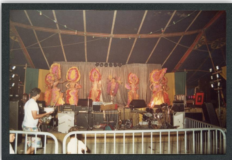
Le spectacle sous chapiteau