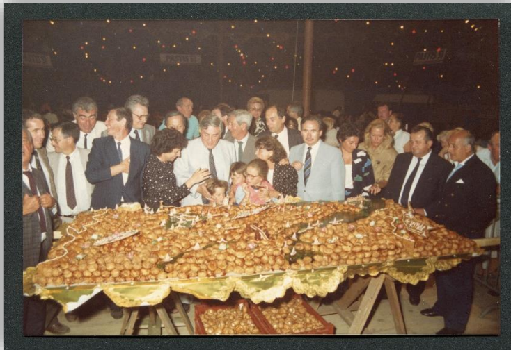
La pièce montée en choux représentant l'estuaire de la Gironde

Parmi les invités politiques de cette année-là, citons : Valade, Lataillade, Boyer-Andrivet, Pintat, Bébéar, Martin, Des Esgaulx, Cazentre. La comédienne Marthe Mercadier, fidèle vacancière du lieu, est également présente. Placées sous le signe de l'Europe, les festivités accueillent les stands des villes jumelées : la bière pour Sandhausen (Allemagne) et l'artisanat pour Ubeda (Espagne). Leurs recettes sont reversées au comité d'entraide local.