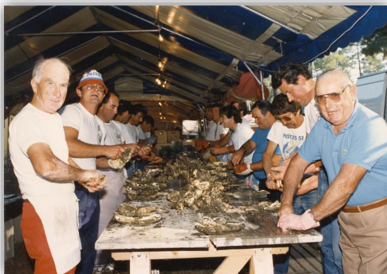
Les bénévoles à l'ouverture des huitres