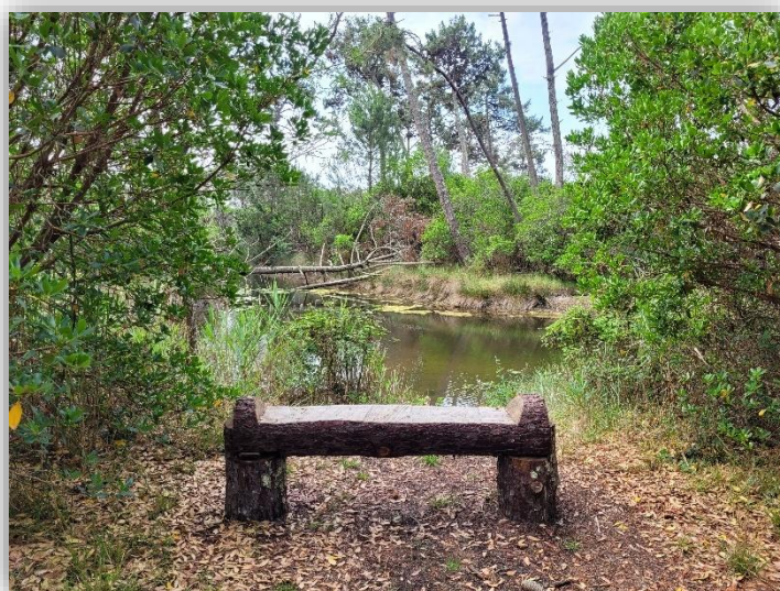
Les Réservoirs de Piraillan, une fenêtre ouverte sur la nature

Le Conservatoire du Littoral devient propriétaire par cession gratuite de l'Etat en 1996. La gestion est confiée à la commune depuis plusieurs années. Les réservoirs de Piraillan retrouvent leur statut de réserve naturelle. Depuis la protection du site, les plantes ont repris leur place. A chaque saison, la faune et la flore des réservoirs de Piraillan évoluent : plusieurs espèces de grands mammifères, d'insectes et d'oiseaux vivent sur le site.