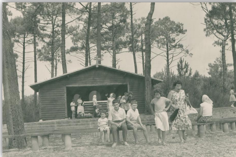
Piraillan – La chapelle Notre-Dame-de-la-Forêt dans les réservoirs