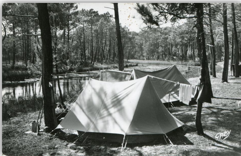
Piraillan – Le terrain de camping dans les réservoirs, années 1960

Un article de Sud-Ouest du 10 août 1954 vante les mérites du « très beau camp aménagé de Piraillan (eau potable, électricité, ravitaillement, douches, w.c., lavoirs, jeux) » qui accueille les campeurs pour 60 francs par personne et par nuit. Un camping-club est créé à l'été 1957, avec pour objectif « le développement des activités sportives, culturelles et de plein air ».