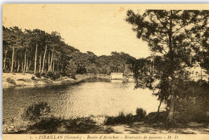
Les Réservoirs à poissons de Piraillan

A marée descendante, l'écluse est ouverte afin de vider partiellement les réservoirs. Un panneau grillagé à mailles fines, placé en amont devant l'écluse, empêche les poissons déjà à l'intérieur de sortir et de s'échapper. A marée montante, l'écluse est toujours ouverte, mais le panneau grillagé est enlevé, pour laisser les eaux entrer et avec elles, de nouveaux poissons.