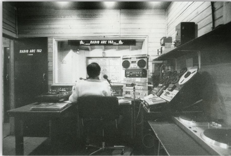
Les locaux de la radio ARC 102 dans les Réservoirs de Piraillan, années 1980 (fonds photographique de la mairie, Archives municipales de Lège-Cap Ferret)