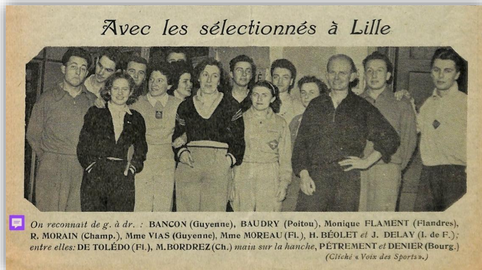
Les pongistes sélectionnés pour la coupe de France interligues de 1953 ( Tennis de table n°89, décembre 1953)