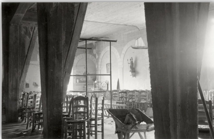
Cap Ferret - L'intérieur de la nouvelle église lors des travaux

Au fil des ans et de l'afflux toujours croissant de fidèles, particulièrement en période estivale, la chapelle de deux cents places devient trop exigüe. De grands travaux sont lancés, sous l'impulsion de l'Abbé Marquaux, curé du Cap Ferret. La bénédiction des fondations et de la première pierre de la nouvelle église a lieu le dimanche 19 août 1956. La petite chapelle est peu à peu recouverte d'une structure plus imposante. Le 21 août 1966, pour la seconde fois, le Cardinal Paul Richaud, Archevêque de Bordeaux, préside la bénédiction solennelle à l'issue de la fin des travaux. Moderne et très dépouillée, tout en béton et vitraux colorés, Notre-Dame-des-Flots devient à l'époque la deuxième église de France à se doter de cloches électroniques en cristal.