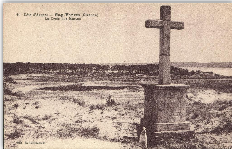
Cap Ferret - La croix des Marins (Fonds François Bisch, Archives de Lège-Cap Ferret)