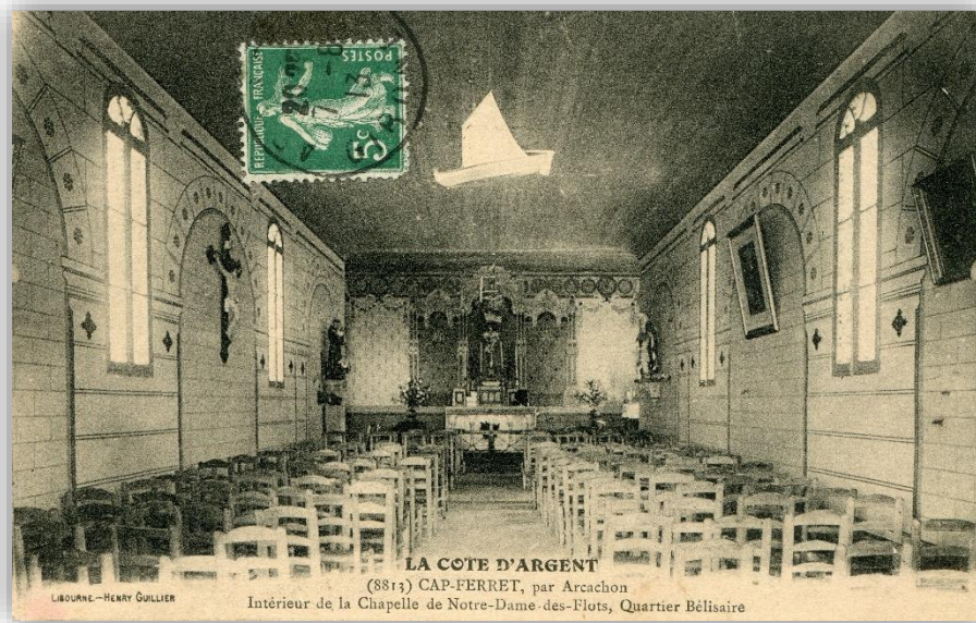
Cap Ferret - L'intérieur de la chapelle Notre-Dame-des-Flots, années 1910