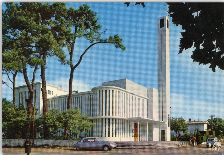
Cap Ferret - La nouvelle église Notre-Dame-des-Flots